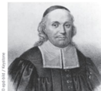
Kupferstich Paul Gerhardt (1607–1676), lutherischer Theologe und Dichter 17. Jahrhundert; aus der Bildersammlung des evangelischen Predigerseminars in der Lutherstadt Wittenberg

Eigenes Leid bleibt dem Ehepaar nicht erspart. Nach nur acht Monaten stirbt im Januar 1657 ihre erste Tochter. Drei weitere Kinder müssen die Gerhardts dann in Berlin nach nur